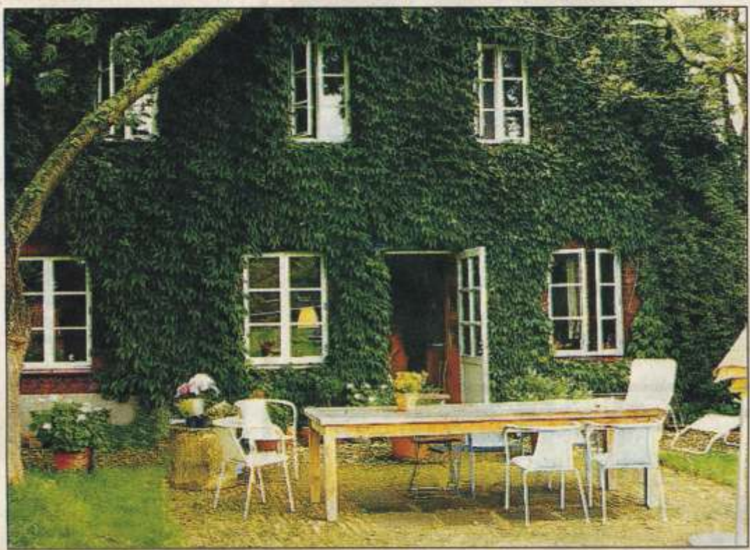
Aufgrund der traditionellen Bauweise sind die dänischen Fenster hervorragend geeignet für Altbausanierung und Denkmalpflege.