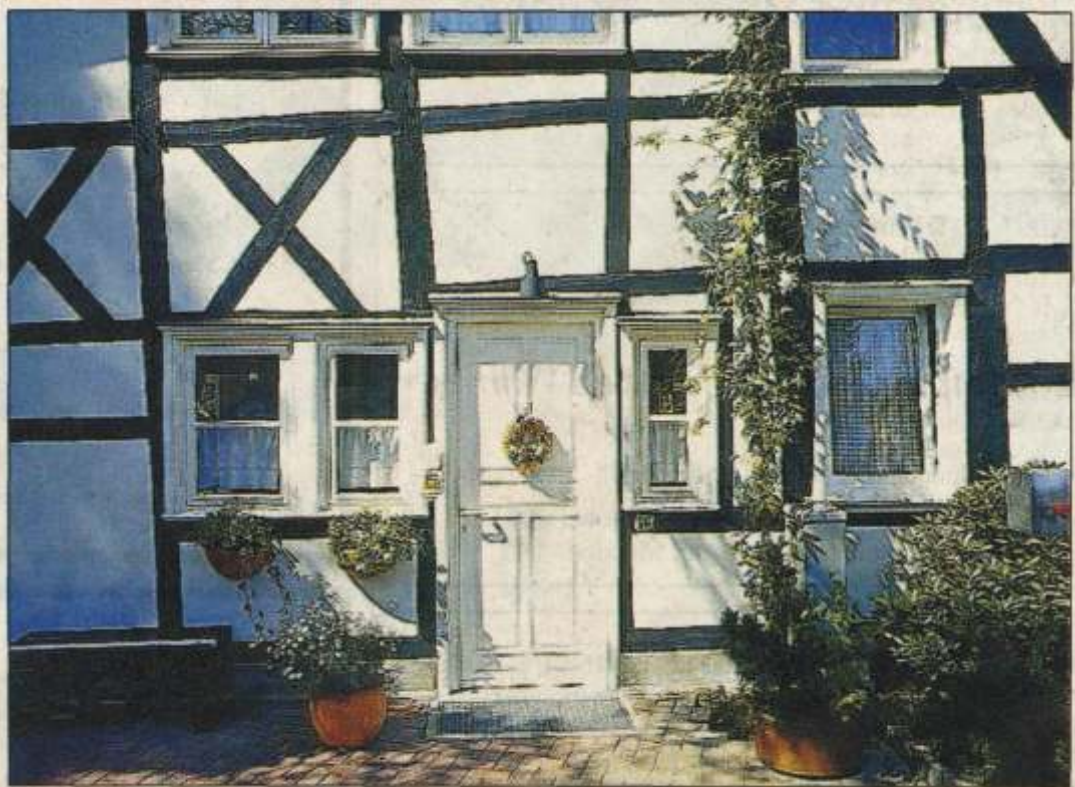
Erstklassige Verarbeitung mit viel Liebe fürs Detail machen die Fenster im Innenbereich zu einem liebenswerten Möbelstück.